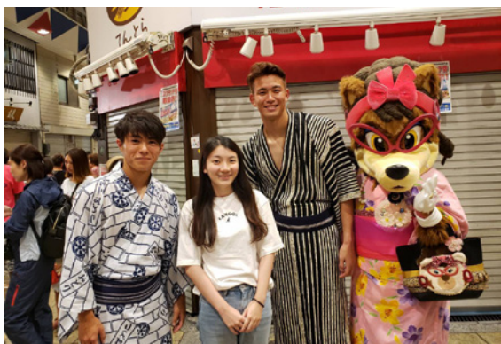
▲遊學課程中包含許多課外活動與文化體驗，是相當寶貴的回憶與經驗。