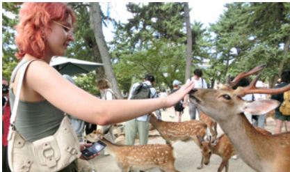
▲ 由學校帶領至奈良一日遊