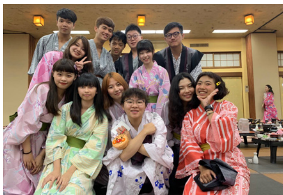
▲夏季來日本一定要進行的浴衣體驗！