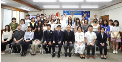
▲ 夏季課程入學式。每一年都有各國的學生參與