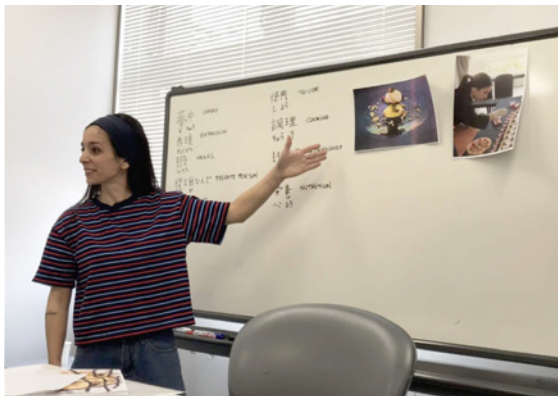
▲學生在課堂中介紹自己的特長與研究成果。