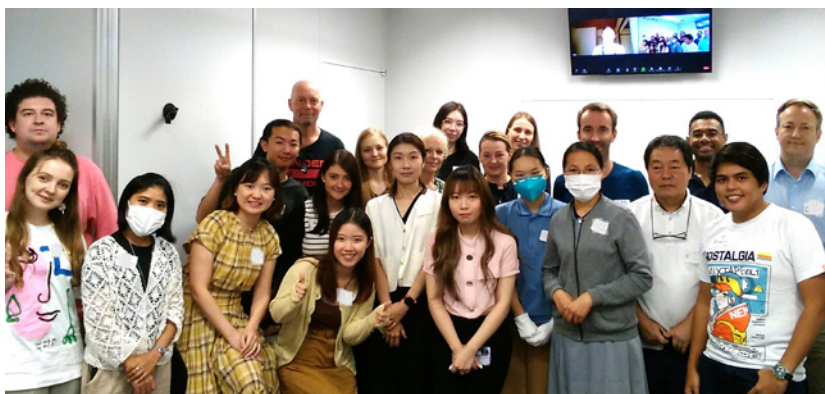
▲來自不同國家、年齡、職業等背景的學生們一同學習。