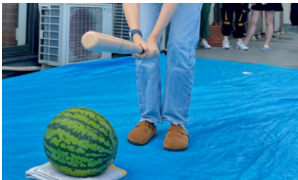
▲歡迎會中進行打西瓜遊戲