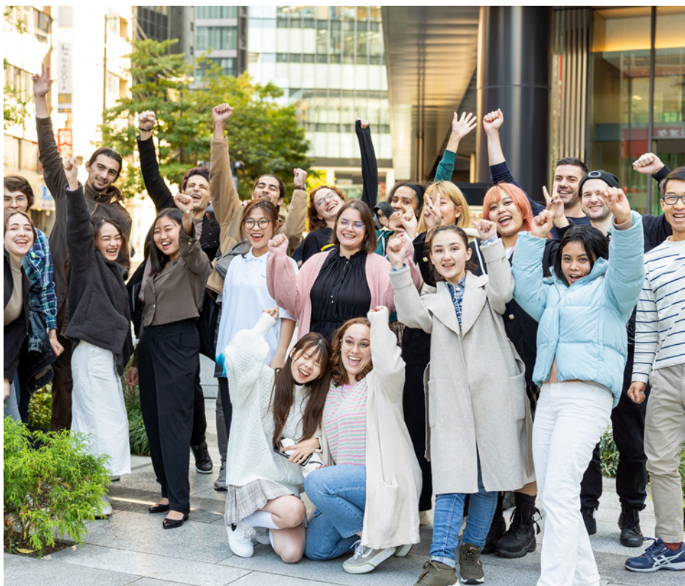
▲來自 30 多個國家的留學生一同學習