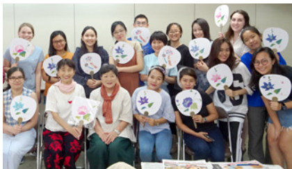
▲ 體驗課程—利用撕碎的日本紙製作團扇