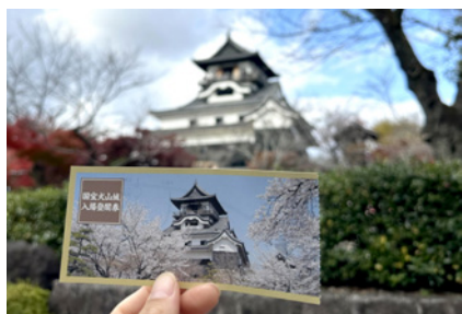
▲由學校帶領參觀「犬山城」