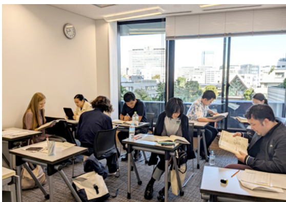
▲課程採小班制，提供縝密的學習支援。同時實行學校及線上的混合教學。