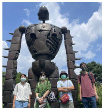
▲吉卜力美術館參訪