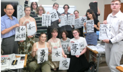
▲ 學生們進行書道體驗