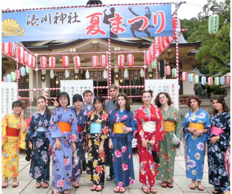
▲ 穿著浴衣參加日本獨有的夏日祭典