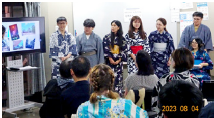
▲ 在結業式體驗浴衣