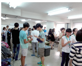
透過茶會派對進行自我介紹與交流

ACD留學情報站 E-mail: jsclub@acd.com.tw TEL: (02)8771-4088・080-080-6278