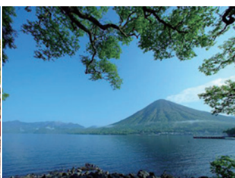
中禪寺湖也是有名的觀光勝地。