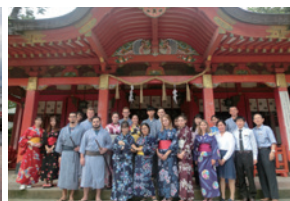
穿著浴衣至鄰近神社參拜