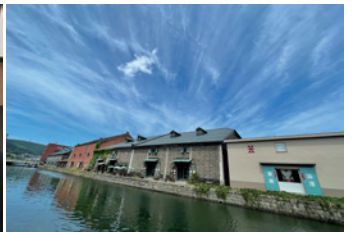
前往小樽運河，體會當地特有的景色