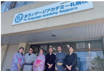
文化體驗—穿著浴衣