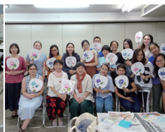
體驗課程——利用撕碎的日本紙製作團扇