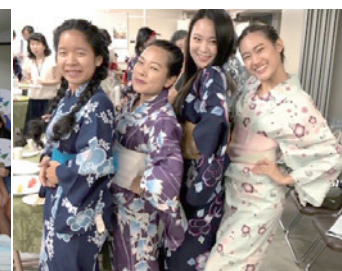
在休業式體驗浴衣