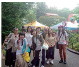
吉卜力美術館參訪

ACD留學情報站 E-mail: jsclub@acd.com.tw TEL: (02)8771-4088・080-080-6278