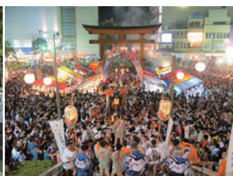
睽違四年，「故鄉宮祭」今年夏天將再度舉辦。