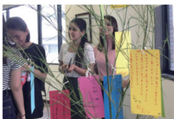
七夕在短冊上寫上心願

ACD留學情報站 E-mail: jsclub@acd.com.tw TEL: (02)8771-4088 • 080-080-6278