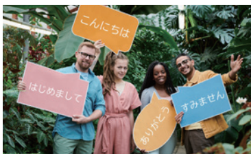
短期課程著重口語交流