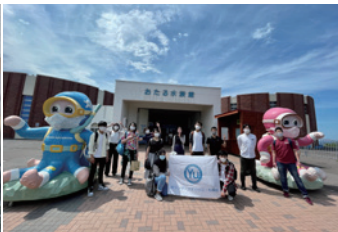
到小樽水族館參訪