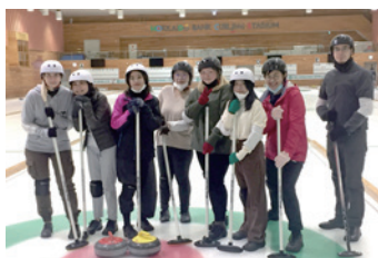
學校大型活動之一「秋季冰壺體驗」

ACD留學情報站 E-mail: jsclub@acd.com.tw TEL: (02)8771-4088 • 080-080-6278