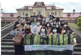
學校大型活動之一「北海道開拓村參訪」