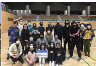
參加札幌市運動大會