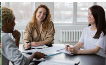
少人數的小組課程