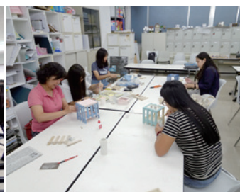
體驗課程——手作可愛的小物