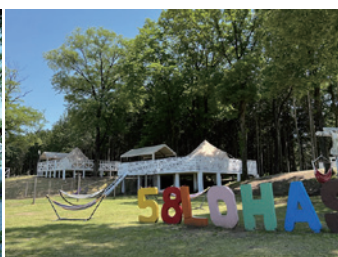
LOHAS CLUB是當地最有人氣的燒烤場地。