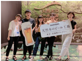
參觀三得利啤酒工廠