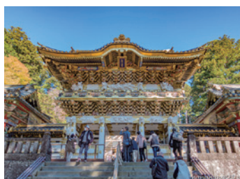
世界遺產「日光東照宮」。