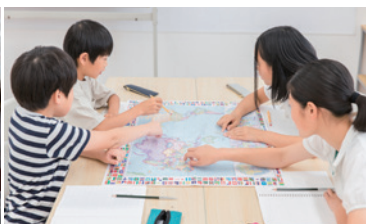
兒童課程以遊戲方式進行教學