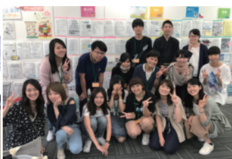
與大學生進行交流