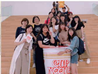
前往橫濱杯麵博物館